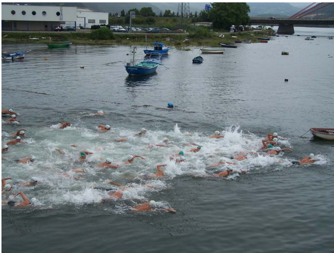
Salida prueba de 5 Km

El pasado sábado se disputo por primera vez en aguas de la ría del Asón la I Travesía de Limpias, prueba perteneciente al IV Circuito Caja Cantabria de Travesías a Nado y que además era Campeonato Regional de Cantabria de Larga Distancia para las categorías Infantil y Máster C1 y C2. La prueba organizada por el Ayuntamiento de Limpias, dentro del programa de sus fiestas patronales, en colaboración con la Federación Cántabra de Natación, aglutino a más de 130 nadadores procedentes de clubes pertenecientes a las Comunidades de Asturias, País Vasco, Castilla y León, Castilla la Mancha, Madrid y Cataluña, para disputar las 3 distancias oficiales establecidas en la normativa.