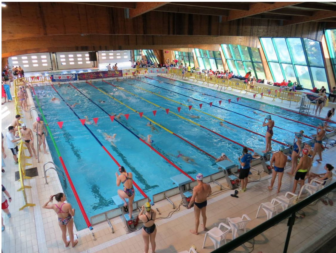
Vista general de la piscina de Cros durante el calentamiento previo.

El pasado sábado se disputó en la piscina municipal del Parque de Cros en Maliaño una nueva jornada de liga de natación para las categorías alevín de último año, infantil, junior y absoluto. A las puertas de los campeonatos de España de invierno de las distintas categorías, esta jornada era la última oportunidad para clasificarse para estos nacionales que se disputaran entre marzo y abril. La participación de nuevo fue muy elevada, con un total de de 483 nadadores de 18 clubes de Cantabria entre las dos sesiones de mañana y tarde. Un extraordinario balance de participación en la liga individual más importante de la natación de Cantabria.