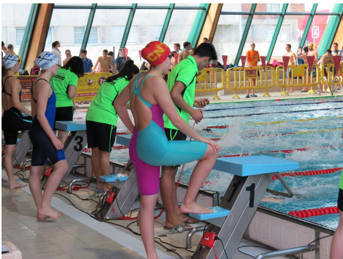
Durante la celebración de una de las pruebas de la jornada de tarde.

Después de la disputa de las sesión de mañana con los alevines e infantiles, fue el turno de las categorías de mayor edad de la Liga. Más de 200 deportistas se dieron cita para disputar el mismo programa de pruebas que los más