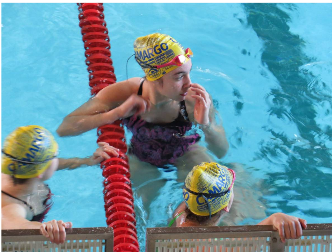
Nadadoras del CN Camargo durante el calentamiento.