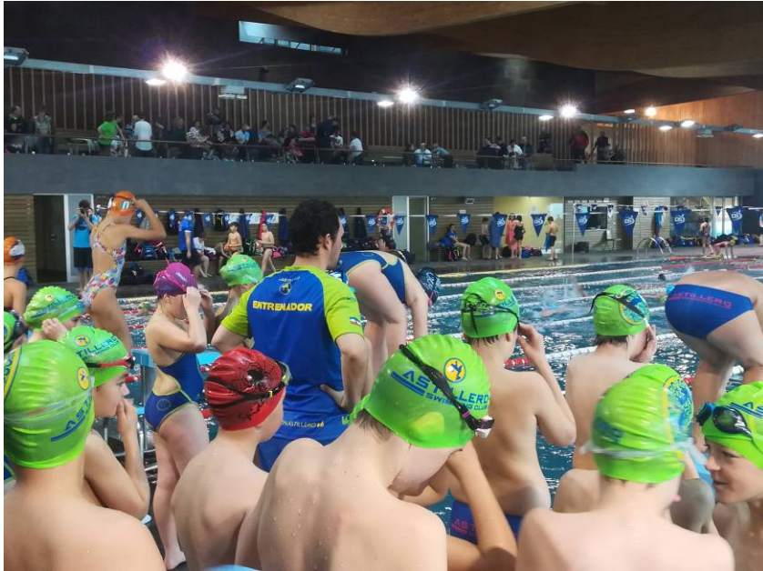
Deportistas de CN Astillero en el calentamiento previo.