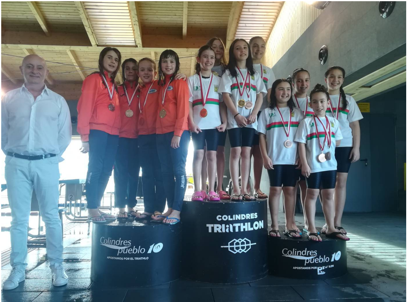
Podium relevos femeninos 4x50 estilos.

Tras finalizar la jornada la clasificación, el equipo de la Escuela de Torrelavega obtuvo un total de 196 puntos, que sumados a los alcanzados la jornada anterior sigue de líder provisional por equipos con un total de 760 puntos. La Escuela de Santoña, con 138 puntos en esta jornada, se consolida en la 2ª posición de la liga con un total de 549 puntos. Mientras que el CN Astillero, que alcanzó 122 puntos, aguanta en la 3ª posición de la categoría con 486,5 puntos.