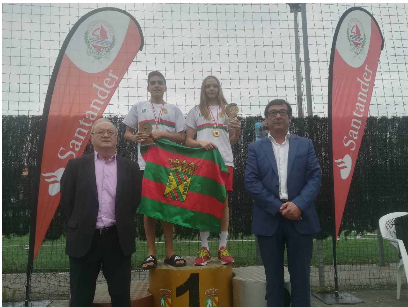
Vencedores alevines junto a los concejales de Cayón.