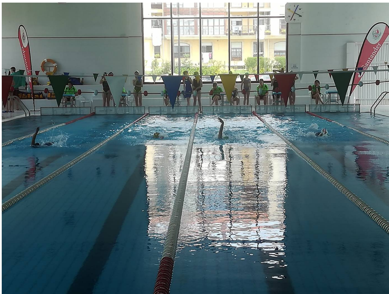
Pruebas de espalda.