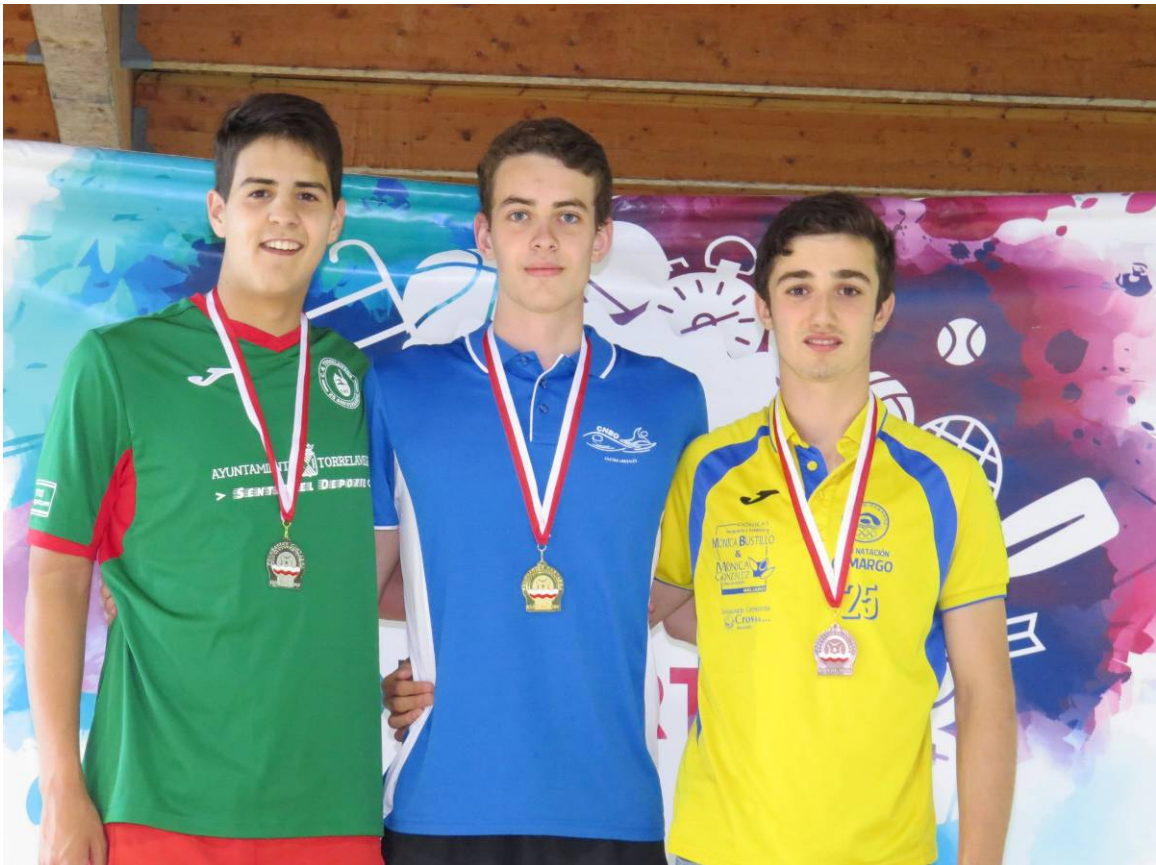
Podium 100 braza masculino.