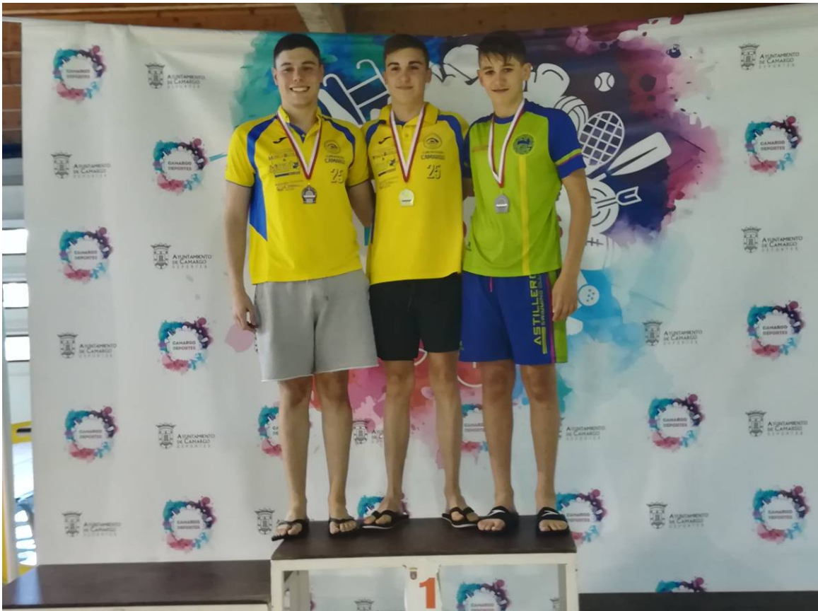
Podium 200 espalda masculino.