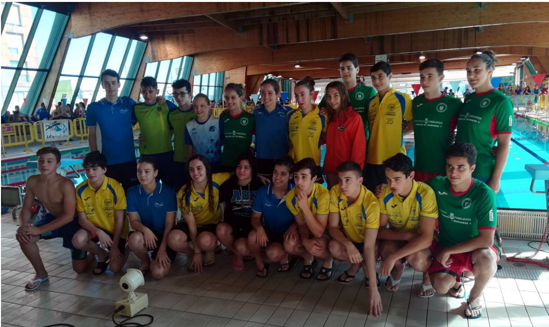
Homenaje a los cántabros que acudirán a los nacionales de verano.