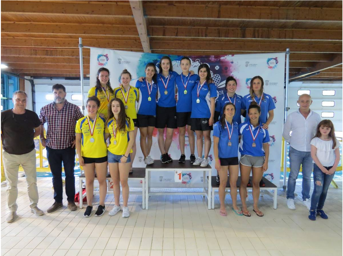
Podium relevos 4x100 estilos feminino.