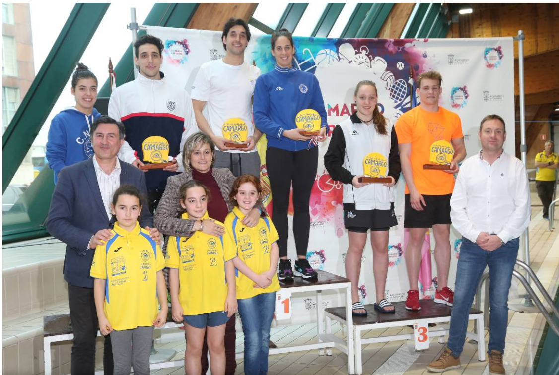
Podium de Vencedores absolutos del Trofeo.

ANA PARTE, LA NADADORA CÁNTABRA MÁS DESTACADA DEL TROFEO