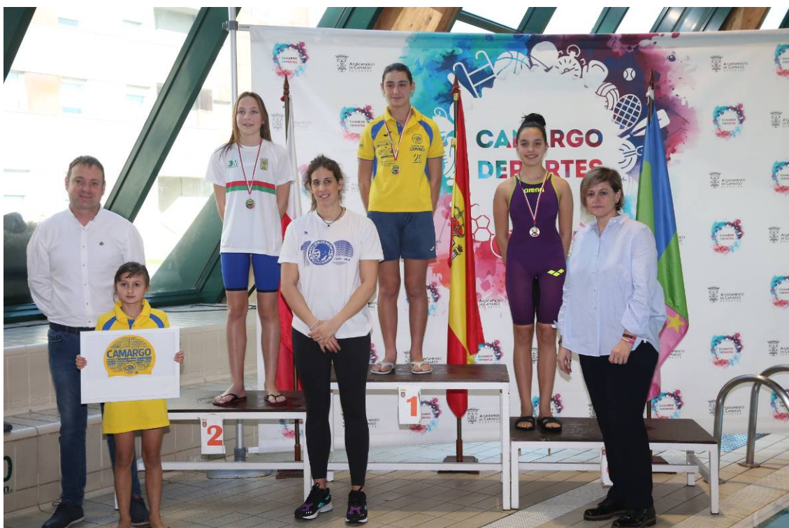
Podium 100 metros libre alevin.

El sábado por la mañana compitieron los más pequeños de edades comprendidas entre los 10 y 12 años. En esta categoría participaron un total de 423 nadadores (180 chicos y 243 chicas), con el objetivo de alcanzar una medalla individual o por equipos. Los combinados cántabros tuvieron una destacadísima actuación en ambas modalidades y colocaron a 32 de los suyos entre los 48 medallistas individuales, y a 4 equipos entre los 6 que se subieron al podio de los relevos.